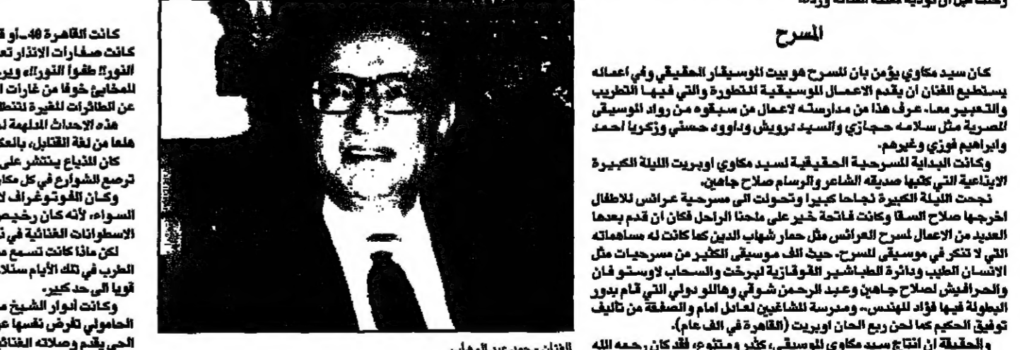
الغناء سيد مكاي والرواق